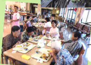
みんなで作ったお弁当はとっても美味しい!!