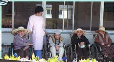
中庭には今年もつつじが満開に咲きました