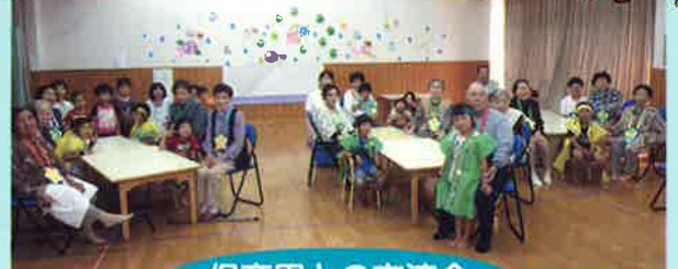
保育園との交流会